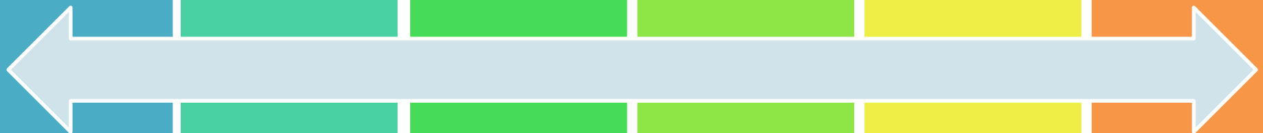
3 pav. Vaiko ugdymosi kryptys