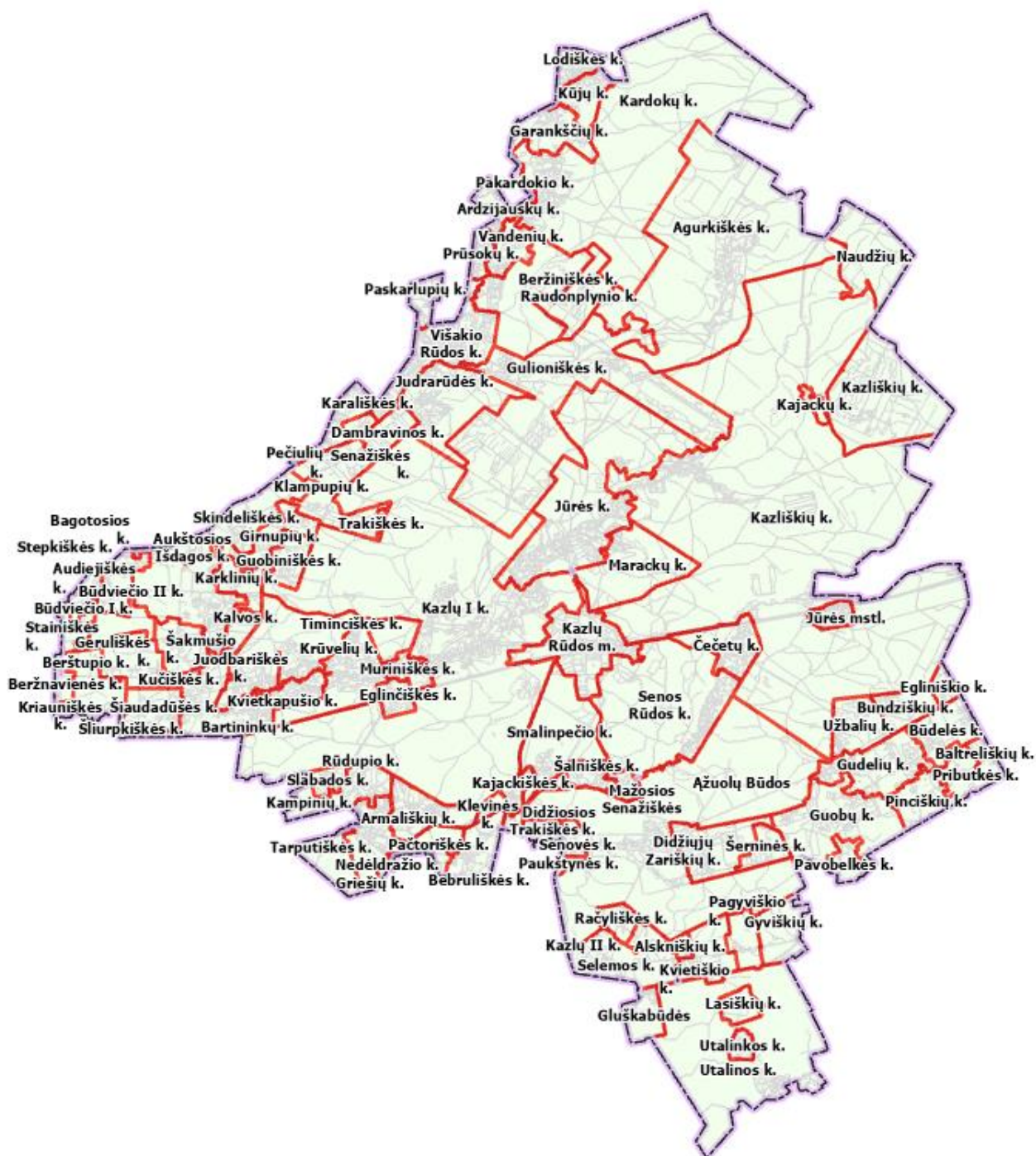
4.1 pav. Kazlų Rūdos seniūnijos naujai nustatomų gyvenamųjų teritorijų ribos