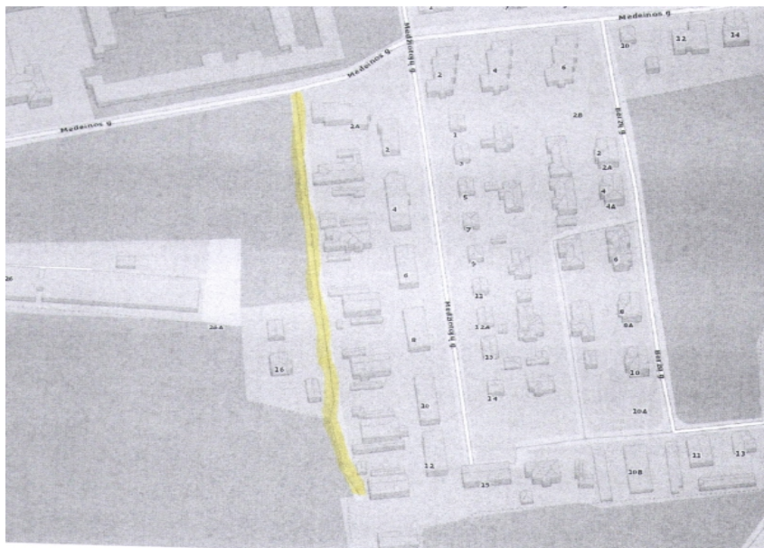
1 pav. Situacijos schema

Komisijos pirmininkė informuoja, kad Administracijos iniciatyva svarstomas klausimas dėl situacijos schemeje (1 pav.) nurodytos (pažymėtos) gatvės, kuriai nėra suteiktas pavadinimas, įvažiavimo iš Medeinos g, Kazlų Rūdos m. įtraukimas į Sąrašus.