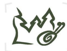
Simbolis / ženklas